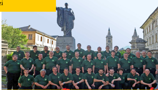
Coro Verrès di Verrès (AO) Diretto dal M° Albert Lanìe

Libera uscita Zolicheur San Matio Belle rose Ta-pum Niña mersé Jodel a sera